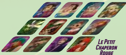
LE PETIT CHAPERON ROUGE

Les similitudes (ou différences) entre le personnage secret et les personnages des cartes Indice sont limitées uniquement par l'imagination du narrateur : détails physiques, émotions, métier, idées, etc. C'est aux autres joueurs de comprendre ce que le narrateur essaye de suggérer !