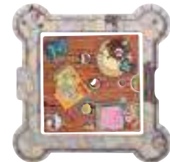
balcon circulaire, chambre