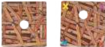
4 étages d'échafaudage