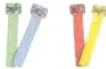
4 poussoirs (1 prince et 3 chevaliers)