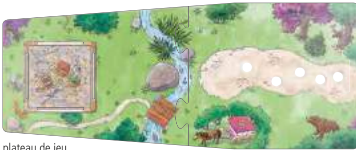
plateau de jeu