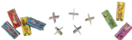
12 compagnons de 5 couleurs